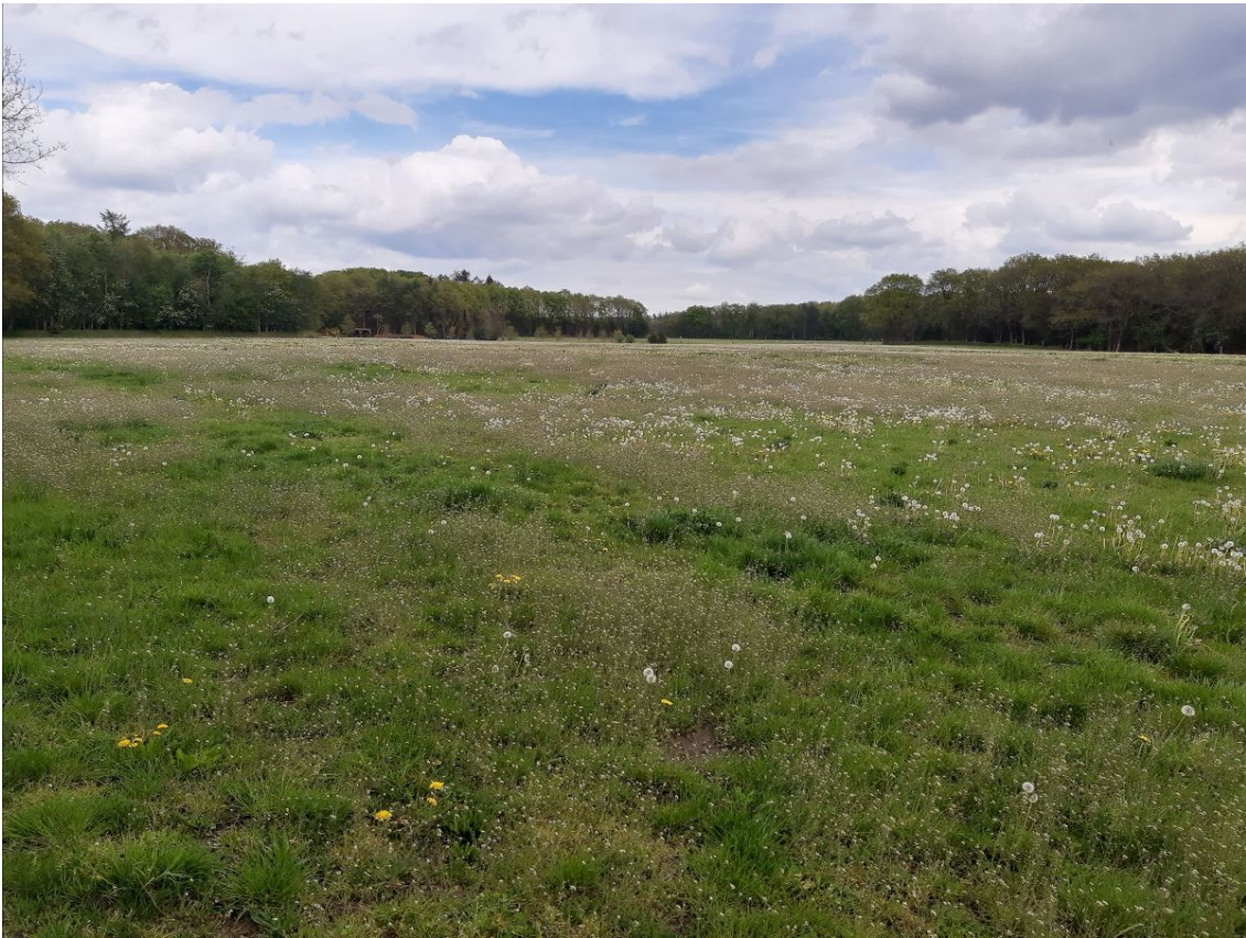
Vorige zondag: Het perceel in Hooghalen met uitgebloeide paardenbloemen.